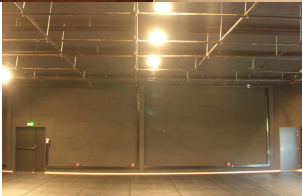
STUDIO O'POSSE — Le Garage, 8 rue André et Yvonne Meynier, 35000 Rennes